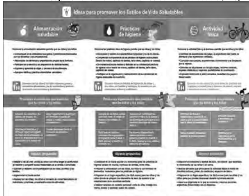
Gráfico 1. Caja de herramientas de Estilos de Vida Saludable (EVS)