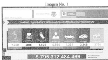
Subdirección de Protección UNP

Consideramos pertinente puntualizar que, de acuerdo al Decreto 4065 de 2011, la Unidad Nacional de Protección se creó como una entidad administrativa del orden nacional con personería jurídica, autonomía administrativa y patrimonio independiente, adscrita al Ministerio del Interior, y que tiene el carácter de organismo nacional de seguridad cuyo fin es articular, coordinar y ejecutar la prestación del servicio de protección de manera especial a las personas que se encuentren en situación de riesgo extraordinario o extremo de sufrir daño contra su vida, integridad, libertad y seguridad personal o en razón al ejercicio de su cargo y adelantar las funciones relacionadas para la ejecución de planes, programas, proyectos acciones y estrategias orientadas para tal fin. Además, debe articular, coordinar y ejecutar la prestación del servicio y garantizar la oportunidad, eficiencia e idoneidad de las medidas de protección de las personas que determine el Gobierno Nacional. Se recalca que para el año 2018 cerró con un total de 7.169 protegidos por la UNP, y a través de las medidas de protección que se detallan a continuación: