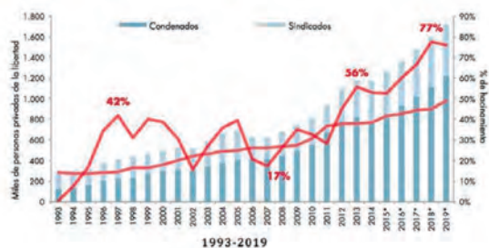
Gráfica 1. Diagnóstico y proyección de cupos y situación jurídica de la PPL

(extraída de: Observatorio de Política Criminal, Mirada al estado de cosas institucional del sistema penitenciario y carcelario en Colombia, 2017. Pág. 6.)