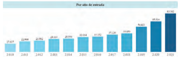
Gráfica 1. Denuncias por delito de estafa a nivel nacional. Tomado de tablero de control "Entrada de noticias criminales al Sistema Penal Oral Acusatorio en Colombia" de la Corporación Excelencia en la Justicia. Filtros: Estafa.

Dentro del total de denuncias reportadas a nivel nacional entre 2010 y 2021, el 3.36% (467.535) son por el delito de estafa. Las denuncias por este delito han tenido una tendencia al incremento.