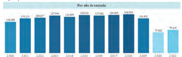
Gráfica 2. Denuncias por delito de estafa a nivel nacional. Tomado de tablero de control "Entrada de noticias criminales al Sistema Penal Oral Acusatorio en Colombia" de la Corporación Excelencia en la Justicia. Filtros: Lesiones personales.

este periodo. Las denuncias por este delito en los años 2020 y 2021 han sido más bajas que en años anteriores.