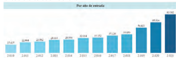
Gráfico 1. Denuncias por delito de estafa a nivel nacional. Tomado de tablero de control "Entrada de noticias criminales al Sistema Penal Oral Acusatorio en Colombia" de la Corporación Excelencia en la Justicia. Filtros: Estafa.

Dentro del total de denuncias reportadas a nivel nacional entre 2010 y 2021, el 3.36% (467.535) son por el delito de estafa. Las denuncias por este delito han tenido una tendencia al incremento.