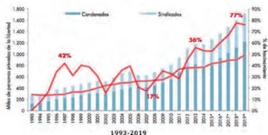
Gráfica 1. Diagnóstico y proyección de cupos y situación jurídica de la PPL

(extraída de: Observatorio de Política Criminal, Mirada al estado de cosas institucional del sistema penitenciario y carcelario en Colombia, 2017. Pág. 6.)