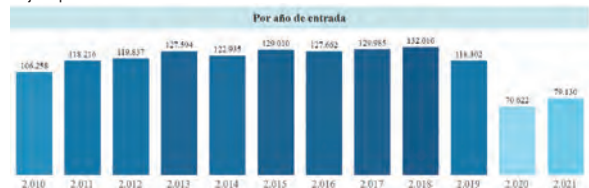
Gráfico 2. Denuncias por delito de estafa a nivel nacional. Filtros: Lesiones personales.

este periodo. Las denuncias por este delito en los años 2020 y 2021 han sido más bajas que en años anteriores.