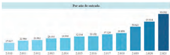
Gráfica 1. Denuncias por delito de estafa a nivel nacional. Tomado de tablero de control "Entrada de noticias criminales al Sistema Penal Oral Acusatorio en Colombia" de la Corporación Excelencia en la Justicia. Filtros: Estafa.

De las 467.535 denuncias por el delito de estafa en el periodo reportado, 0.54% se encuentran en etapa de ejecución de penas, y 0.85% en etapa de juicio.