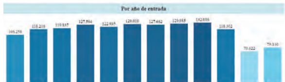
Gráfica 2. Denuncias por delito de estafa a nivel nacional. Tomado de tablero de control "Entrada de noticias criminales al Sistema Penal Oral Acusatorio en Colombia" de la Corporación Excelencia en la Justicia. Filtros: Lesiones personales.

Del total de 1.381.567 denuncias, 12.230 casos se encuentran en ejecución de penas (0.89%) y 16.895 (1.22%) se encuentran en etapa de juicio. 493.229 se encuentran en etapa de indagación, mientras que 855.685 son querellables (probablemente no se han investigado por incumplimiento de este requisito de procedibilidad).