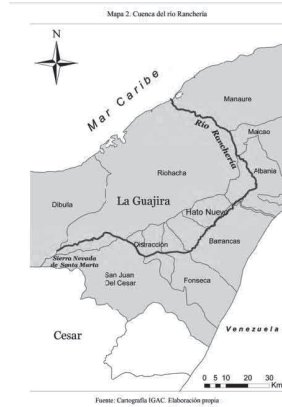
Fuente: Otero, Andrea. Río Ranchería: entre la economía, la biodiversidad y la cultura. Banco de la República. Revista 190. Año: 2013.

Atendiendo a dicha descripción se observa como cerca de 228.000 personas es decir el 22.53% de la población de la Guajira se beneficia del Río Ranchería tendiendo relaciones que van más allá de las ambientales reuniendo las características que ha estipulado la jurisprudencia para declarar cuerpos de agua y diversos ecosistemas como sujetos de derechos.