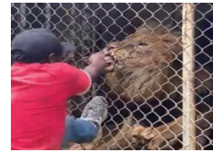
Imagen 4. Caso ataque. Zoológico Jamaica.