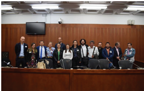
Imagen 6. Gran reunión con investigadores y trabajadores de zoológicos. Octubre 20 de 2022