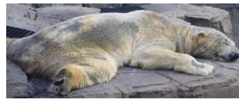
Imagen 4. Caso Arturo. Zoológico Mendoza, Argentina.