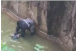
Imagen 2. Caso Harambe. Zoológico Cincinnati. EEUU.

También son recordados los casos del osezo polar Knut, orgullo del zoológico de Berlín, que falleció ahogado en una piscina en plena exhibición ante los humanos 2 , el horrible caso de Harambe, el gorila, quien fue asesinado a balazos por los cuidadores del zoológico de Cincinnati en Estados Unidos por el riesgo al que se expuso un niño, con la negligencia de sus padres, quien cayó al recinto de los gorilas 3 , el caso del león que arrancó los dedos de uno de los cuidadores en el zoológico Attractions de Jamaica 4 , el caso del Júpiter, el león que falleció en Cali después de padecer traslados injustificados de sitios donde no se garantizaba su bienestar 5 o el caso de Arturo, el último oso polar argentino, que murió en zoológico de Mendoza después de padecer de una serie de problemas, incluidos temas de pobre enriquecimiento, ausencia de bienestar y estrés térmico, entre otros, que motivaron el rechazo ciudadano y reabrieron el debate sobre si es ético o no mantener animales en cautiverio, entre muchos otros casos que se dan a diario en todo el mundo afectando a cientos de miles de animales.