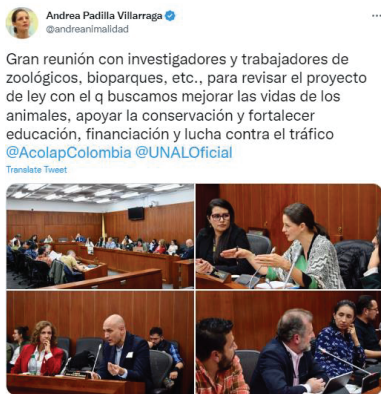
Imagen 7. Gran reunión con investigadores y trabajadores de zoológicos. Octubre 20 de 2022

A manera de recuento, de dichas mesas de trabajo a las que asistieron, entre otros, representantes del Acuario de Santa Marta, Parque Ukumarí, Parque Jaime Duque, Piscilago, ACOLAP, Universidad Nacional de Colombia, zoológico Santa Cruz, Fundación