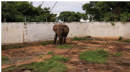
6 Mas información en https://www.elespectador.com/colombia/barranquilla/denuncian-presunto-mal-estado-de-elefante-en-zoologico-de-barranquilla/

De igual manera, el reciente y sonado caso del elefante Tantor que se encuentra ubicado en el zoológico de Barranquilla y que en unas fotos publicadas recientemente evidencian una terrible situación de bienestar 6 , deben ser motivos más que suficientes para generar una transición amigable hacia un modelo que respete la individualidad animal y en el que, por supuesto, no se afecten los mínimos vitales de quienes desarrollan estas actividades, pues en el centro del proyecto se contempla la posibilidad de que la exhibición siga siendo posible, pero bajo parámetros más estrictos de bienestar animales y solo con fines educativos.