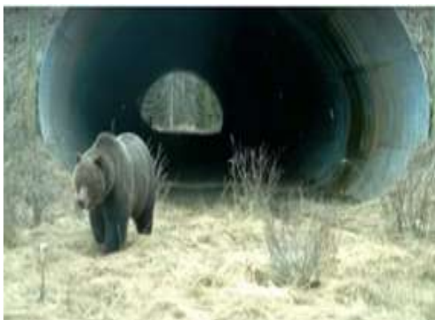
Vía trans-canadiense 68