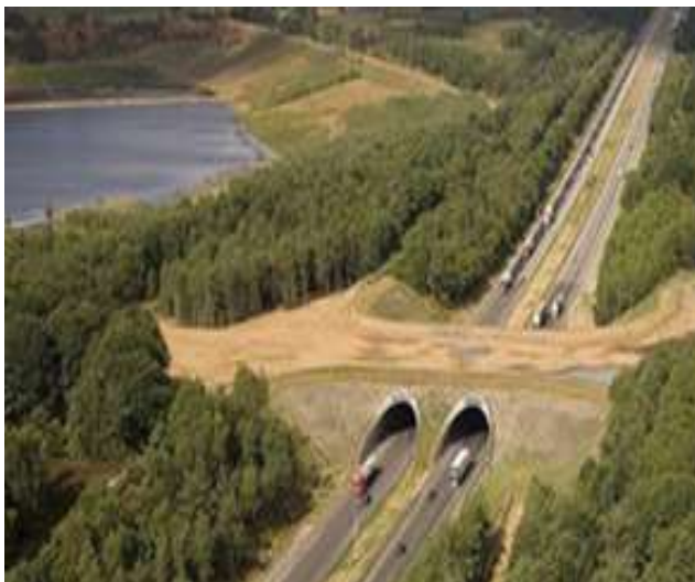
Bélgica. 69