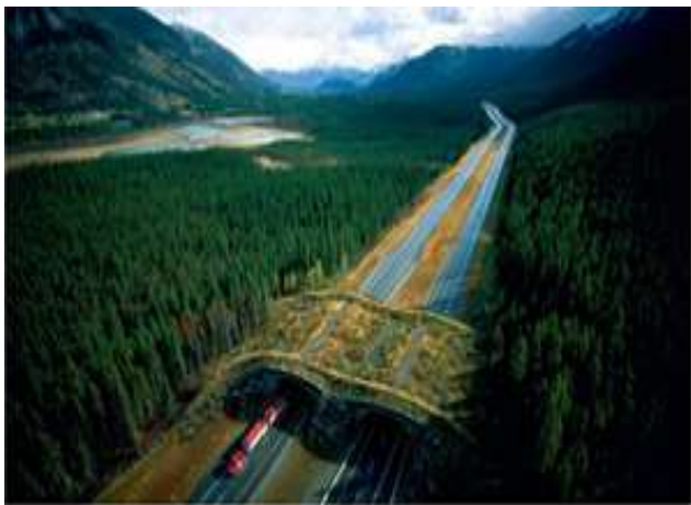
Banff National Park Alberta, Canadá, - vía Joel Sartore 67