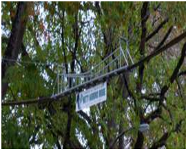
Washington. 76