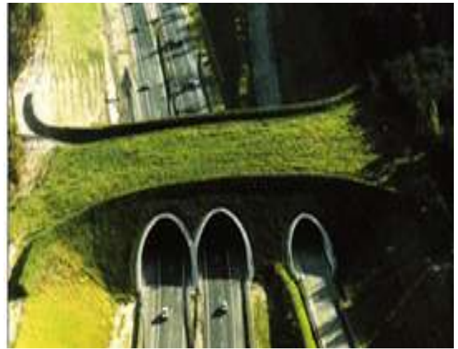
Países Bajos.- vía Izismile 74