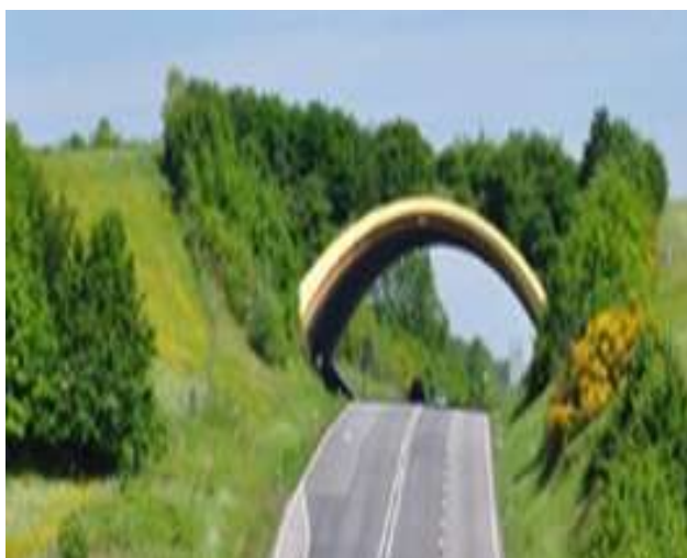
Alemania. Imagen vía reddit 72