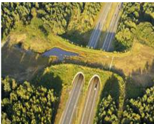
Países Bajos. Imagen vía reddit 71