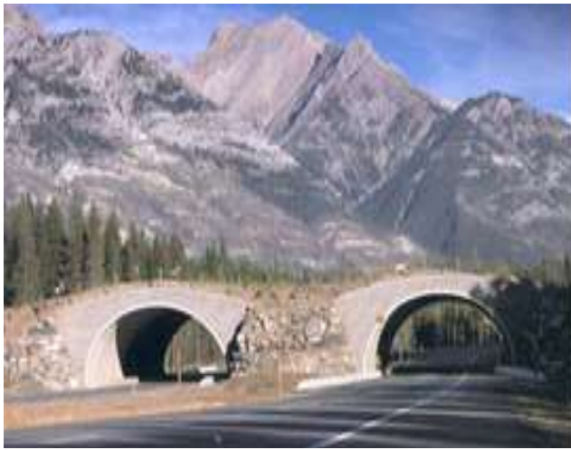
Banff National Park. Alberta, Canadá. 73