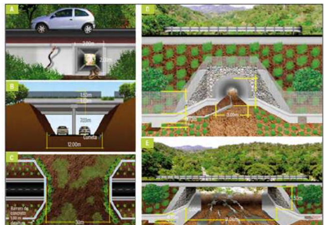
Ejemplos de estructuras que funcionan como pasos de fauna: A) caja de losa, B) paso superior de fauna, C) viaducto, D) paso inferior de fauna, E) puente.”

Con respecto a este tipo de estructuras en igual sentidos se han planteado otras definiciones que de igual forma contribuyen a la interpretación de lo que se plantea con la iniciativa legislativa, al respecto Animal - La Revista, (2017) definió este tipo de estructuras como “estructuras artificiales que permiten a los animales cruzar barreras generadas por las obras civiles. Pueden ser túneles, puentes elevados, tendidos de cable, escalerillas, e incluso en algunas obras como embalses se pueden diseñar escaleras para peces”; información proporcionada con fundamento en declaraciones dadas por José Fernando Navarro, biólogo e investigador asociado al grupo media ambiente y sociedad de la universidad de Antioquia.