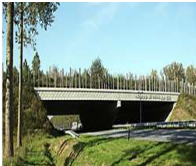
Holanda – Cruce para animales silvestres 70