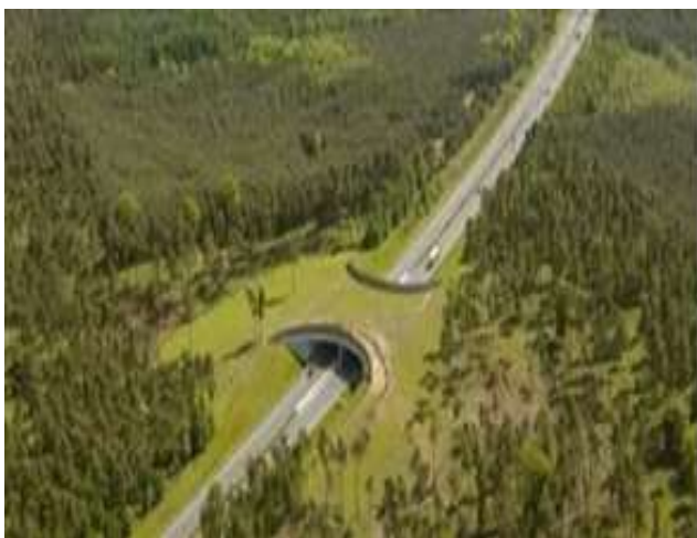
Alemania – Autopista 77