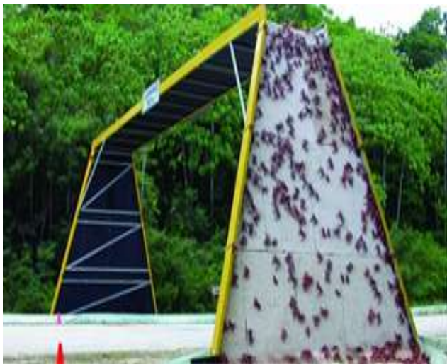
Christmas Island, Australia. 75