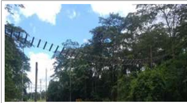
Colombia - Meta 79