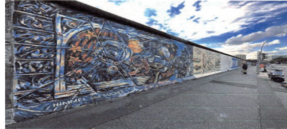
Foto de East Side Gallery (Berlín) tomada de la página web unsplash (Autor: Rikin Katyal - libre de derechos de autor). Disponible en: https://unsplash.com/es/fotos/una-pared-con-graffiti-zS9Z6QeCQ0?utm_content=creditShareLink&utm_medium=referral&utm_source=unsplash

Sin embargo, es importante señalar, que la descripción de los posibles conflictos de interés que se puedan presentar frente al trámite del presente proyecto de ley, conforme a lo dispuesto en el artículo 291 de la Ley 5 de 1992 modificado por la Ley 2003 de 2019, no exime a los Congresistas de identificar causales adicionales.