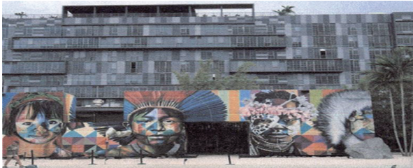
Foto de Wynwood (Miami)

proyectos con alianza público privada, un ejemplo de estos es el "Neighborhood Revitalization District-2" 20 .