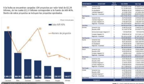
Gráfico 2. Informe de los proyectos cargados a través de la ventanilla única - Asignación para la Inversión Regional 40%, OCAD Llano, 2024.

Se expone como ejemplo, el Informe de los proyectos cargados a través de la ventanilla única para ser financiados con recursos de la Asignación para la Inversión Regional en cabeza de las Regiones - OCAD Llano por poner un ejemplo, presentado por la secretaria técnica el día 15 de abril de 2024.